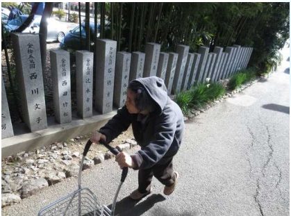
今年もみなさまにとって 良い年になりますように。