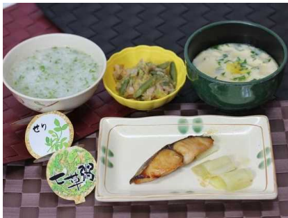
【お正月の特別献立 その3】 7日といえばこれですね。 「七草粥・さわらの照り焼き 梅和え・小田蒸し」