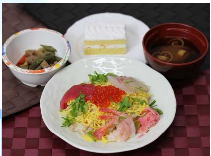
1月29日(誕生日会の特別献立) 「散らし寿司・筑前煮・赤だし・ケーキ」 大人気メニューの散らし寿司です。 みなさまにとっても喜んでいただきました。