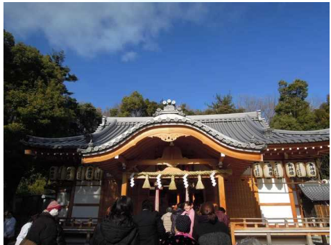
何をお願いされているのでしょうか…。